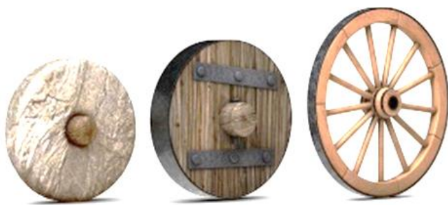
Рис.1 – Модели колёс древних времён