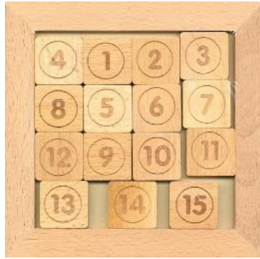
Рисунок 1. Вариант образца изделия «Настольная детская игра «Пятнашки»