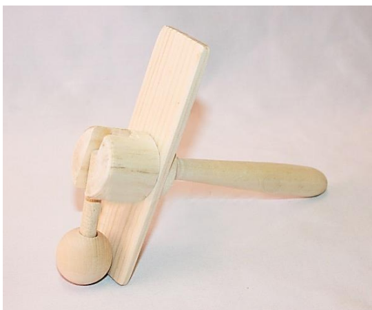
Рис.1 – Изделие «Колотушка»